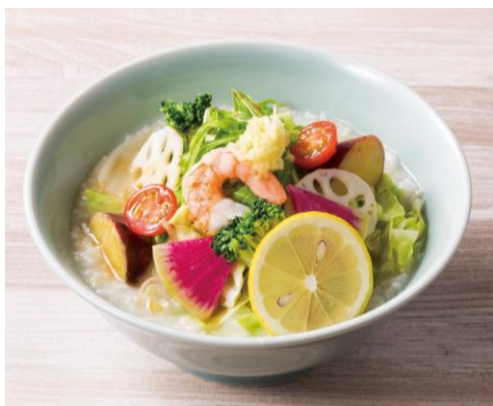
▲8種野菜のベジかゆ（おかゆと麺のお店 粥餐厅）

注目を集めているのは、 台湾や香港の朝食でも馴染みの数種類の薬味などをトッピングする“おかゆ” や、 しっかりとした味わいで、トマト、チーズ、ほうれん草など、様々な素材を取り入れた進化系“おかゆ” 。これまでの“おかゆ”のイメージとは異なる、 バリエーションの豊富さ、食後の満足感が高いしっかりとした味わいが人気を集めています。