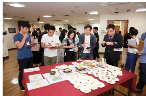
アンケートを記入する参加者一同