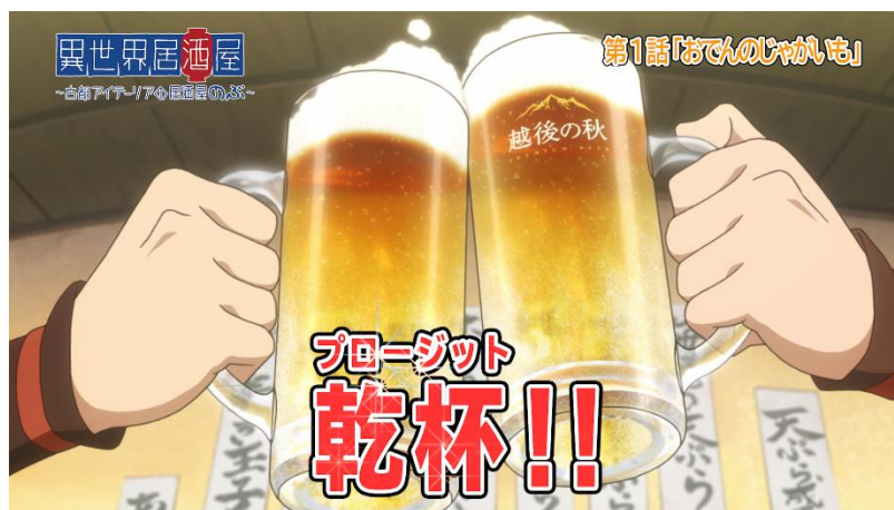
(c)蟬川夏哉・宝島社/古都アイテールア市参事会

ぐるなびは、「世界に誇れる日本の食文化を守り育てる」という企業使命のもと、海外からも注目を集める日本のアニメとコラボレーションすることで、外食文化のさらなる活性化に貢献してまいります。