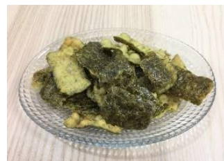
▲のり天わさびしょうゆ味