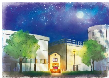
リアル店舗「居酒屋のぶ」イメージ

（※1）製作委員会：株式会社サンライズ、株式会社バンダイナムコライツマーケティング、株式会社ぐるなび、株式会社バンプレスト、株式会社アサツー ディ・ケイ、松竹株式会社