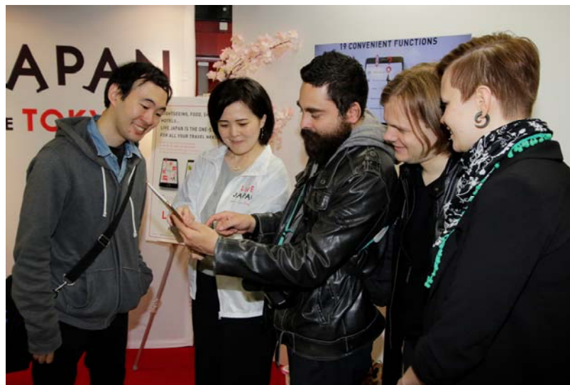
体験イベントイメージ

参画記念として、6月30日に羽田空港国際線ビル駅改札付近にて、訪日外国人観光客を対象にした体験イベントを行います。