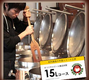
オリジナルビール 醸造体験チケット

▲木内酒造『常陸野ネスト ニッポニア+ホップで燻したベーコンセット & オリジナルビール醸造体験チケット』 満足の15L!! ★価格：33,318円(税込み)