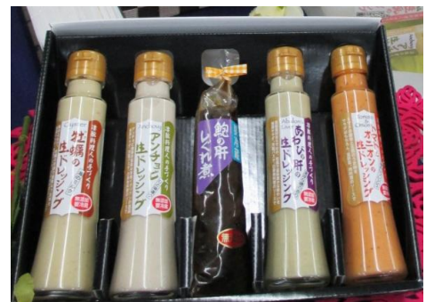
▲ごちそう心匠の匠 生ドレッシングセット