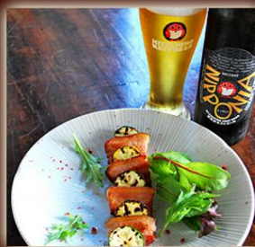
常陸野ネスト ニッポニア + ホップで燻したベーコンセット

オリジナルビール「ニッポニア」と「ホップで燻したベーコン」に、日本酒造の情緒溢れる空間で、15Lのビール醸造体験ができる、体験チケット付きギフトです。15Lは330MLボトルの約45本分に相当作れるので、家族みんなで作り、届いたらBBQで友人にも振舞うという、夏らしい楽しみ方ができそうです。