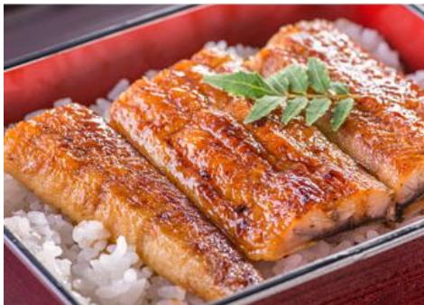
▲川口水産の国産特大うなぎ