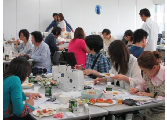
(写真) 試食会会場の様子。

うなぎは、昨年よりも価格が高騰しているにも関わらず、昨年の試食会ランキング(2位)よりも順位を上げて1位となりました。そして、本来“名わき役”であるドレッシングがうなぎと並んで1位になるなど、意外な結果となりました。