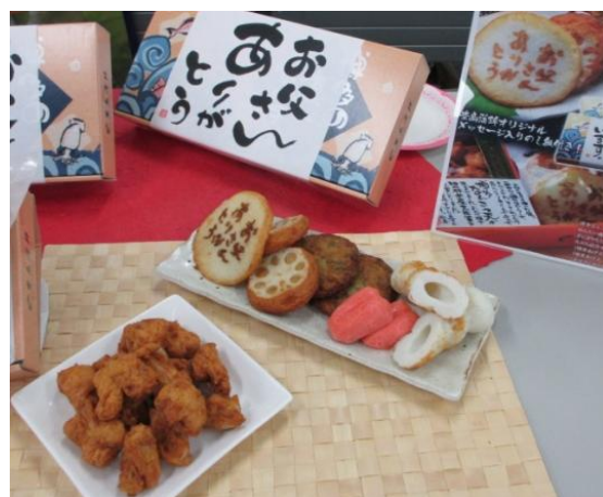
▲豊島蒲鉾の父の日お父さん特選ギフト

3位には、新宿歌舞伎町で40年以上店舗を構える日本料理店「あぐら屋」の「すっぽんスープ」がランクインし、ステーキ有名店「銀座スエヒロ」の高級ローストビーフ、黒毛和牛専門店「聖」のセットと並びました。いずれも“本格的で非常に美味しい”という声が多く、最近話題の“肉ブーム”の影響か、牛肉においては“家族みんなで食べられる”という“思惑”が見え隠れする結果となりました。