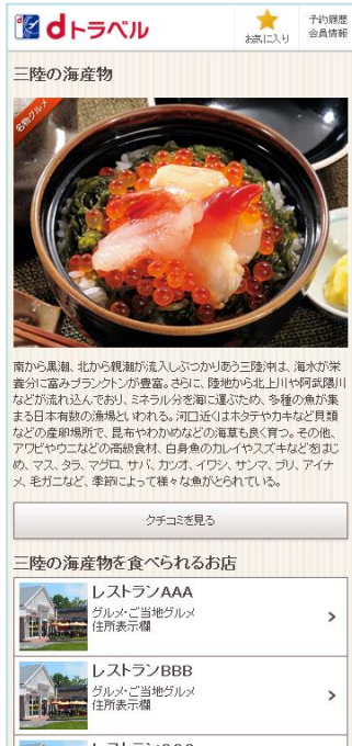
「ぐるたび」提供のご当地グルメページ(スマートフォン版)