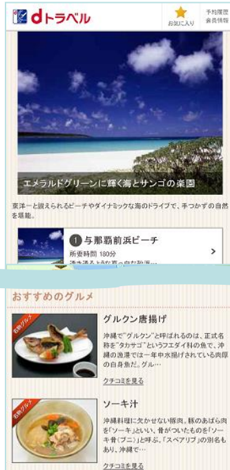
「ぐるたび」提供のご当地グルメ掲載旅のススメ ページ(スマートフォン版)