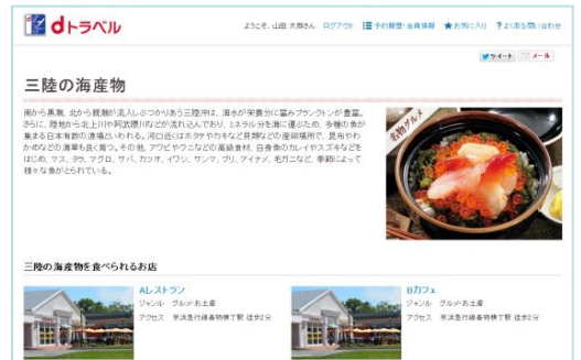
「ぐるたび」提供のご当地グルメページ(PC版)