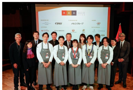
「RED U-35 2023」授賞セレモニーの様子

「RED U-35 (RYORININ's EMERGING DREAM U-35)」とは、夢と野望を抱く、新しい世代の、新しい価値観の料理人（クリエイター）を見だし、世の中に後押ししていくため、これまでの料理コンテストとはまったく異なる視点で、日本の食業界の総力を挙げて開催している料理人コンペティションです。2013年に誕生した「RED U-35」は、熱意あふれる料理人たちの挑戦、歴代の審査員たちの目線、数多くの企業等の支援に支えられ、2023年に記念すべき第10回を迎えることができました。