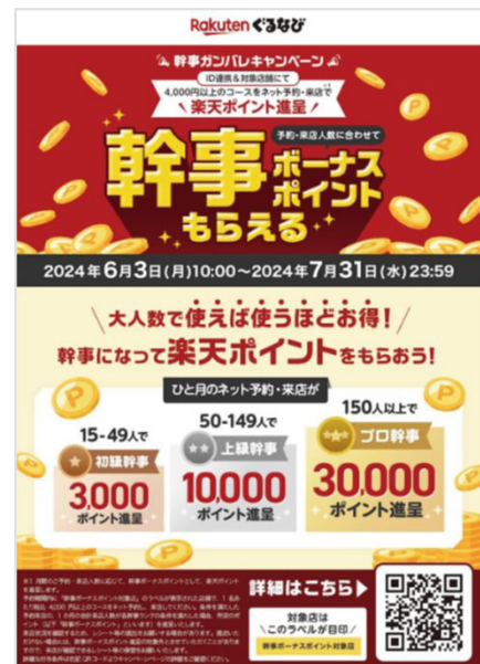
▲ポスターイメージ