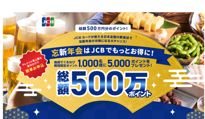
▲キャンペーンページ

※キャンペーンには注意事項がございます。詳しくはキャンペーンページで詳細をご確認ください。