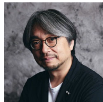
小山 薫堂 放送作家