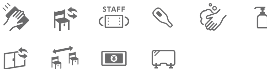
▲表示されるアイコン一覧

「店内や設備等の消毒・除菌・洗浄の実施」「お客様の入れ替わり都度の消毒」「スタッフのマスク着用」「スタッフの検温を実施」「スタッフの手洗い・消毒・うがい」「除菌・消毒液の設置」「店内換気の実施」「入店人数や席間隔の調整」「お会計時のコイントレイの利用」「仕切り板の設置」「体調不良のお客様は入店をお断りする場合があります」「食事中以外でマスク着用のご協力をお願いします」