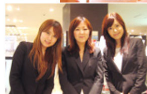
ぐるなびウエディングのプランナーが同行します