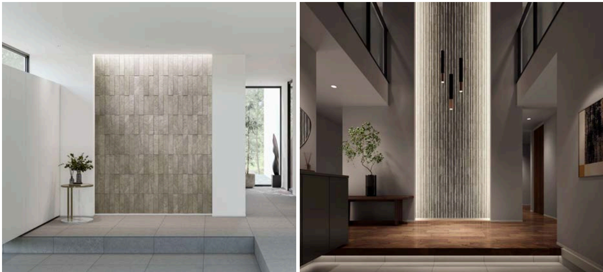
（右）リブスレート施工事例、（左）シングルレース 施工事例

株式会社LIXIL（以下LIXIL）は、優れた調湿機能に加え、気になるニオイやホルムアルデヒドなどの有害物質を低減し、室内の快適な空気環境づくりをサポートする内装壁機能建材「エコカラットプラス」に、玄関や洗面・ランドリー空間におすすめの「リブスレート」「シングルレース」「ルランジュ」の3商品を追加し、2025年4月1日より全国で発売します。また、自分で簡単に取付け・交換できる「エコカラットセルフ」には、色彩豊かな2つのデザインを追加します。