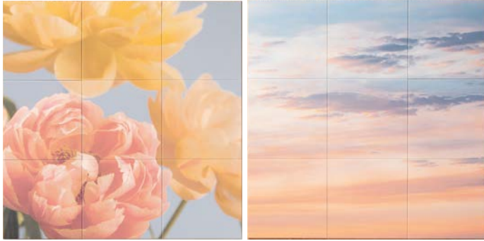
(右)Flowerシリーズ、(左)Photoシリーズ