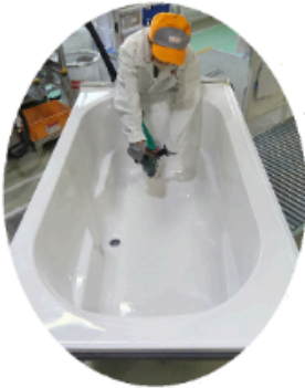
工場にてFRPを成形・加工