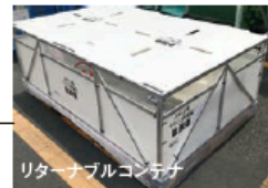
リターナブルコンテナ

工場から現場への製品輸送においてリターナブルコンテナの活用を拡大することで、輸送時の保護フィルムを年間2.3t削減しています。リターナブルコンテナは回収して循環利用が可能です。