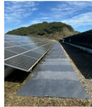
合成樹脂製品へ マテリアルリサイクル