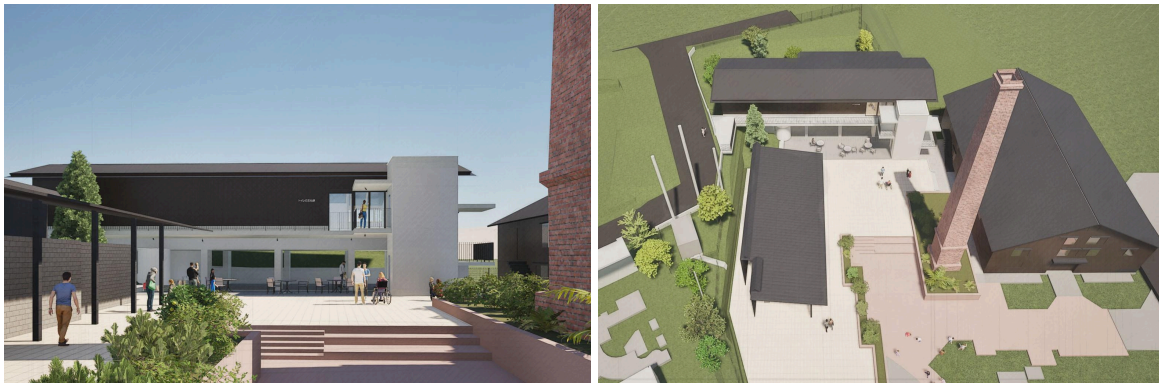
「トイレの文化館」完成イメージ

株式会社LIXIL（以下LIXIL）が運営する、土とやきものの魅力を伝える文化施設「INAXライブミュージアム」（所在地：愛知県常滑市）は、日本のトイレ文化を発信する展示館「トイレの文化館」を2025年4月17日（木）から一般公開します。