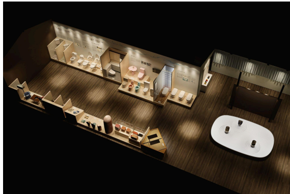
2階 常設展示室イメージ