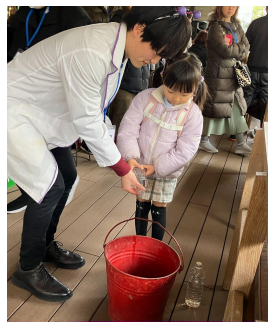
ペットボトルを用いた実験