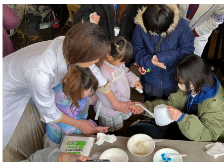
疑似経血・疑似便を用いた実験