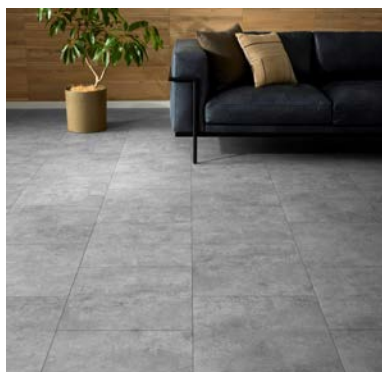
ラフモルタル調455（幅広）