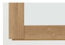
ナチュラルオーク