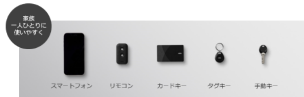
5タイプのカギから、家族一人ひとりの使いやすさに合わせて、自由にセレクト可能