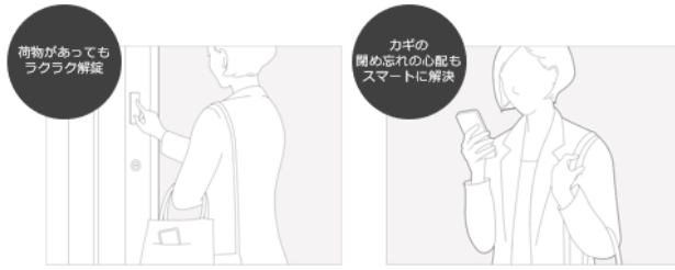
ポケットインで素早く施錠

スマートフォンを“ポケットイン”の状態ですぐにドアの施錠・解錠が可能なスマートロックシステム「FamiLock」を標準搭載。電池式、電気式どちらも設定しています。