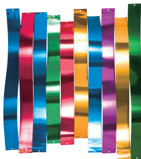
聖徳大学 川並香順記念講堂 緞帳《瑞光》(1980年)のためのアルミニウムの短冊状パーツ W4×H19~50cm/短冊 所蔵:多田美波研究所

新型コロナウイルス感染拡大を防止し、皆さまに安心してご観覧いただくために必要な対策を講じております。当館ウェブサイトから最新情報をご確認ください。