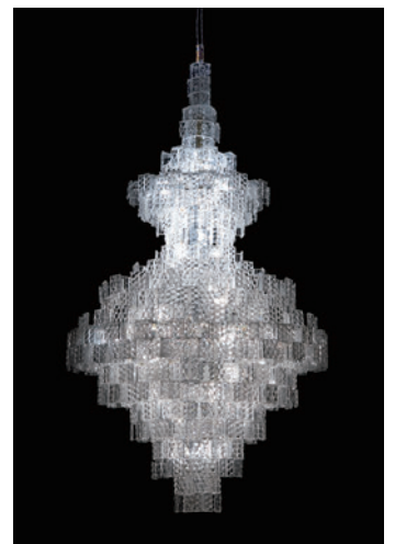
紀尾井ホール シャンデリア(1995年)の模型(S=1/5) Φ30×H56cm 所蔵:多田美波研究所 撮影:佐治康生