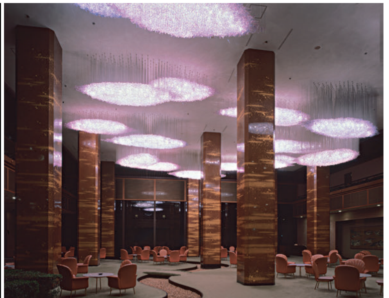
ロイヤルホテル(現リーガロイヤルホテル(大阪)) 光造形《瑞雲》* 1973年 クリスタルガラス、ボールチェーン 平均W350×D150×H50cm 21基