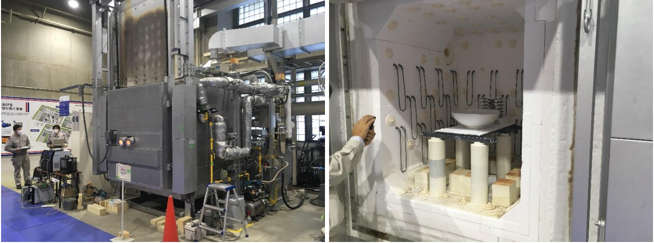
(写真) 東京ガス試験場でのセラミック焼成における水素燃焼試験の様子

LIXIL は、これまで水素への燃料転換が製造プロセスにおいてどのような影響を与えるかの検証を継続的に行ってきました。アルミ溶解、セラミック焼成の高温炉の検証は、東京ガスと共に水素燃焼試験を行い、天然ガスと同様に問題なく水素が使用可能であることを確認しています。