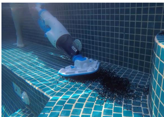
清掃時水中イメージ