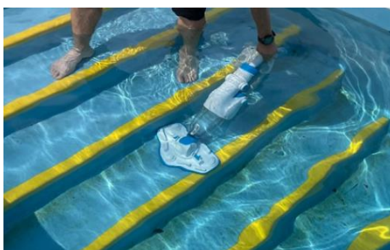
水中スロープ・階段などに最適