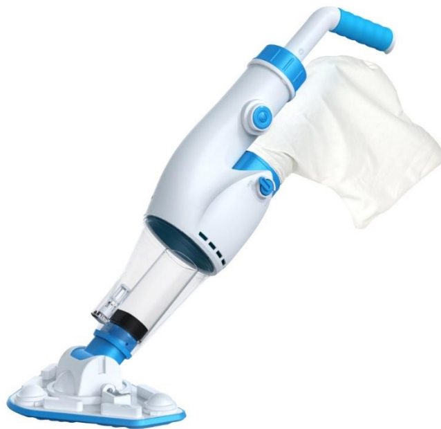
水中専用掃除機プールクリーナーZPC-9015

業務用清掃機器の専門商社、蔵王産業株式会社(本社：東京都江東区、代表取締役社長：沓澤孝則、以下当社)は、2024年11月より水中専用掃除機プールクリーナーミニ“ZPC-9015”を販売開始します。