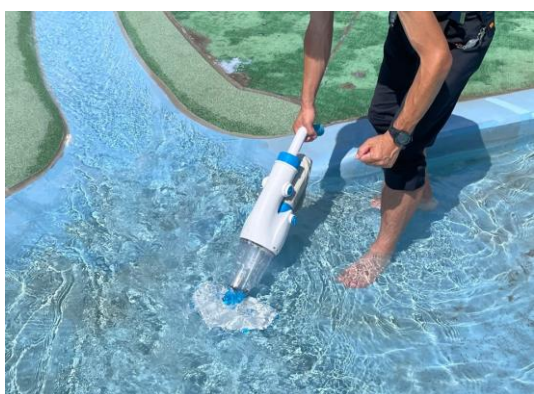
水路・水盤にも使用可能