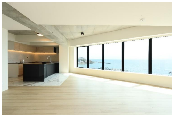
▲リビングからの眺望