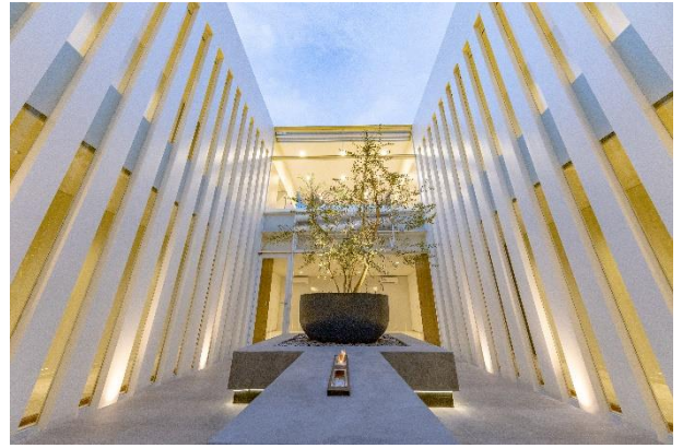
▲2023年に販売した文京区関口二丁目プレミアムリノベーション邸宅

「ジョイコート」シリーズで培ったノウハウをもとに、機能性やデザイン性にこだわった改修を加え、付加価値の創造や収益性の向上など、生活スタイルに合わせた新たな価値を提案します。