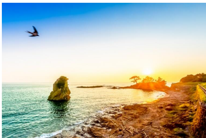
▲秋谷・立石海岸の突き出た大きな奇岩「立石」

※かながわの景勝50選：神奈川県が1976年から選定を始めた「かながわの50選・100選」シリーズのひとつで、1979年に神奈川県の代表的な景勝地を50箇所選定したものです。