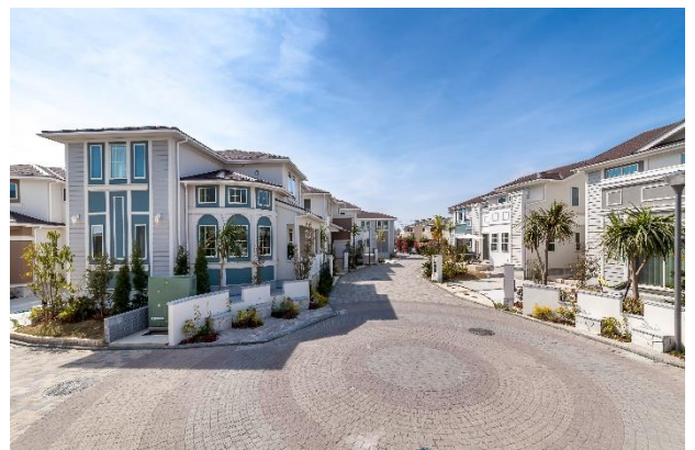
▲2017 年に販売した全 18 邸の茅ヶ崎南湖

横浜市内、湘南、世田谷、目黒を中心に戸建事業を展開している大藤不動産グループが創造的にプロデュースする都市型新築戸建住宅です。1999 年に横浜市磯子区で「ジョイコート磯子ヒルズ」の販売を開始。一邸一邸の個性と共に街並みを創造し、機能やデザインはもちろん、安心・安全な暮らしを提供します。