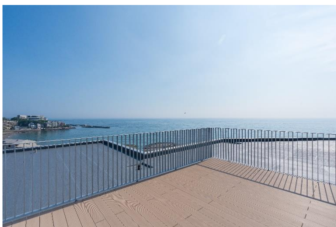
▲最上階5階の特別住戸専用のルーフバルコニー