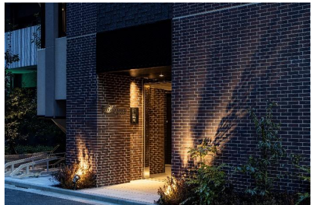
▲2023年に竣工したジョイキューブ浅草橋レジデンス外観

2012年から開始した保有資産としての「ジョイキューブ」シリーズや販売用不動産としての収益レジデンスの売買など、時代の変化に合わせてさまざまな商品を創造しています。