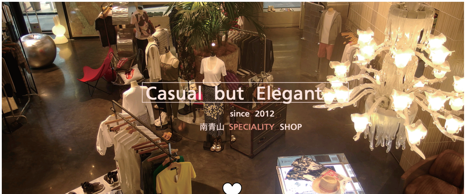
セイズ・ウットゥ コンプレックス店内