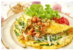
バインセオ風オムレツ