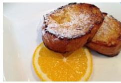
オレンジフレンチトースト