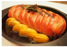
ベーコンミートローフ