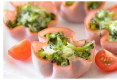
ハムカツブグラタン