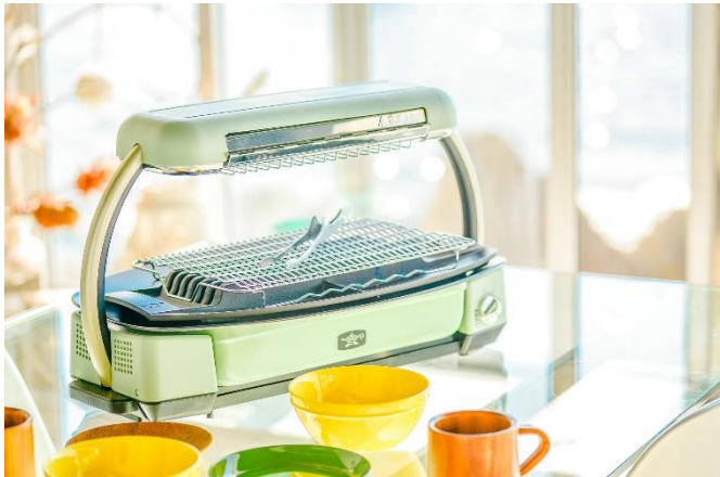
室内で暖かくBBQを楽しめます