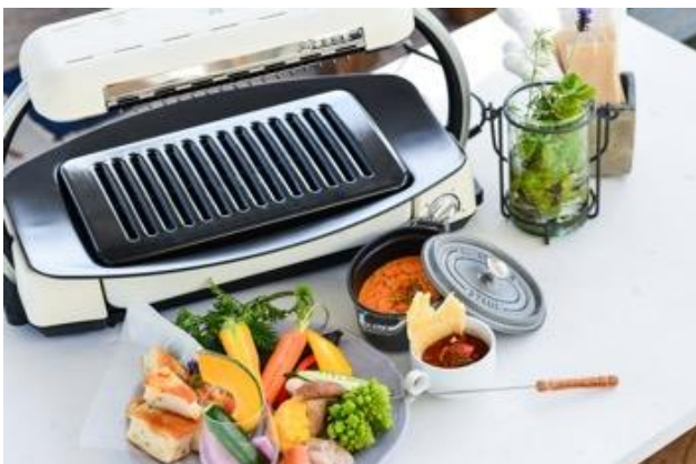
週末限定冬のモーニングメニュー