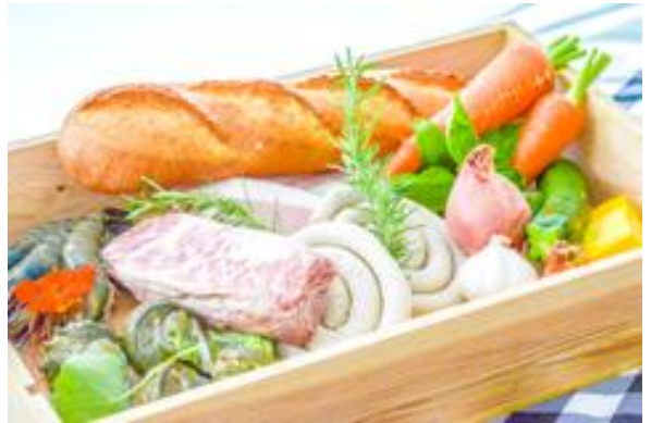
THE HOUSE FARM BBQ デリバリー