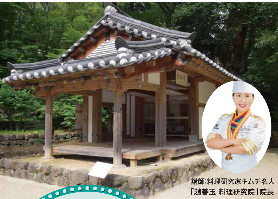
講師:料理研究家キムチ名人 「趙善玉 料理研究院」院長