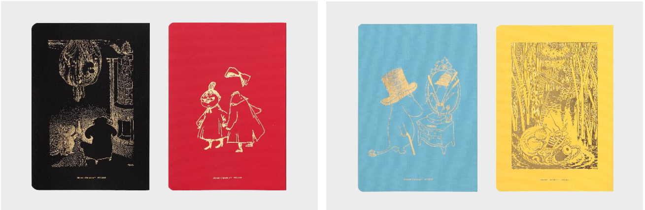
365 デイズノート 採用デザイン ブラック：『ムーミン谷の冬』 レッド：『ムーミン谷の仲間たち』

『1/2 イヤーノート』は『365 デイズノート』の自由度の高いデザインはそのままに、よりコンパクトに持ち運べる 192 ページのノートです。『1/2 イヤーノート』には、小説全 9 巻のうち『ムーミン谷の十一月』『ムーミンパパの思い出』『たのしいムーミン一家』『谷の夏まつり』に登場する挿絵を採用しています。