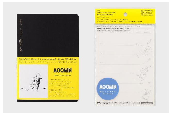
左：1/2 イヤーノート グリッド B6 ムーミンデザイン