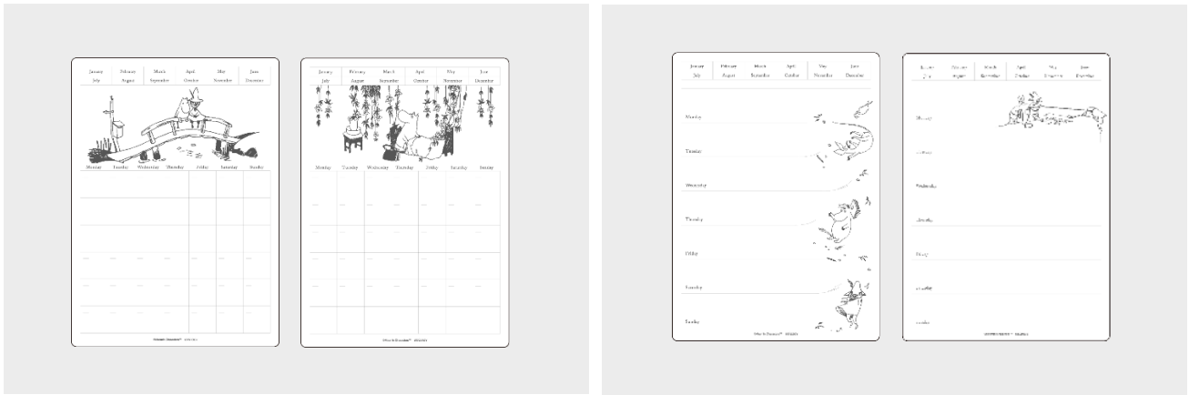
月間カレンダー用採用デザイン：『たのしいムーミン一家』 ※視認性を高めるため、実際の製品より図案を濃く表現しています。