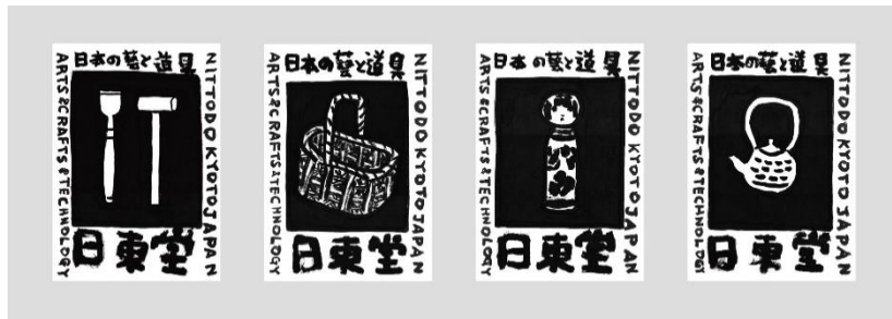
左から「のみとつち」「かご」「こけし」「急須」