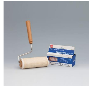
初代のコロコロ (粘着カーペットクリーナー)