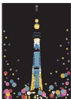
東京スカイツリー