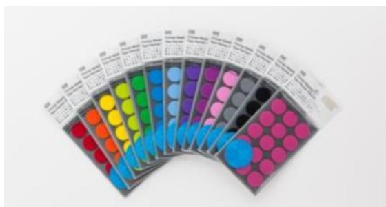
「STÁLOGY」マスキング丸シール

「〔国際〕文具・紙製品展 ISOT」とは、文具・紙製品、オフィス用品が一堂に集まるアジア最大級の展示会です。毎年多数の小売店・卸商が新製品、新商材をいち早く仕入れるために来場し、出展社との間で、活発な受注および商談を行っています。量販店、ホームセンター、スーパーマーケット、コンビニエンスストア、百貨店などはじめ、異業種・新業態の小売店や、法人ユーザー、海外バイヤーなどの来場が年々大幅に増えております。2013年は昨年の75,000名を上回る80,000名の動員を見込んでいます。近年、デザイン性、機能性に優れた文具を求め、アジアを中心に世界中からバイヤーが来場し、日本にいながら海外バイヤーと直接取引できる絶好の場となります。