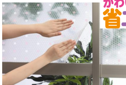
断熱デザインシート使用シーン