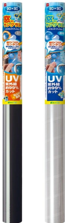
ライトグレー 透明

しかも、UV(紫外線)は約99%カットしますので、肌や家具の日焼けを防止します。