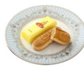
ままだおる (福島県)