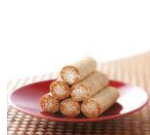
紅葉屋本店 五家寶 (埼玉県)