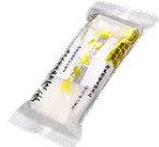
水沢うどん (群馬県)