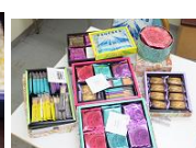
上野風月堂 ゴーフル (東京都)