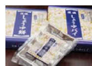
茨城しょうゆパイ (茨城県)