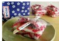
桔梗信玄餅 (山梨県)