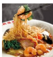
南国酒家 広東麵飯房