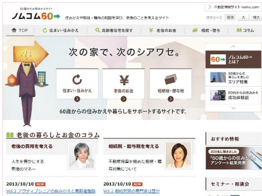
＜ノムコム 60→ トップページ＞