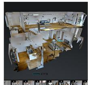
ドールハウスビュー