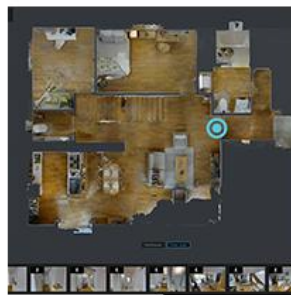
フロアプランビュー