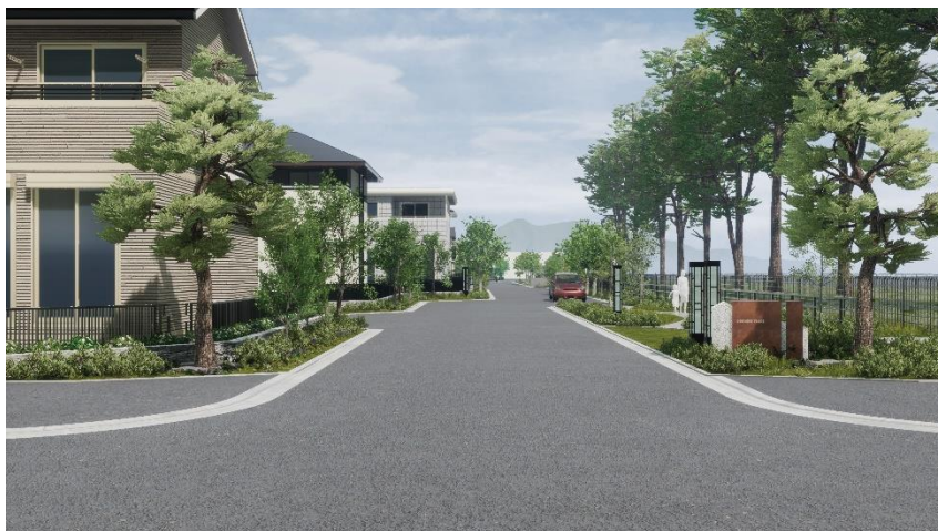
完成予想CG (左から76、96、95、94号棟)

「大らかな自然を背景に形づくられた美しい街並みの中で、空の色、木々の緑を楽しみ、小鳥のさえずりに耳を傾ける。花の香りに四季の移ろいを感じ、庭に植えられた野菜や果物を味わう。人と触れ合い、温もりを感じられるコミュニティの中で、いくつもの思い出が生まれる。」 新たに開校する小中一貫校が隣接し、研究学園の象徴であるテーダマツの並木と、その奥に見える雄大な筑波山を間近に見る地に、自然と共生し、豊かな感性と確かな知性を育む暮らしに満ちた街づくりを目指す「ココチプレイス学園の森」は、“五感”を刺激する街づくりをコンセプトとし、ハウスメーカー大手10社が結集した 全100区画の大規模プロジェクトです。 本プロジェクトの街区の完成とモデルハウスのオープンを記念して、まちびらきフェアを行うこととなりました。研究対象としていただいている筑波大学芸術学系・環境デザイン准教授 渡和由氏ご協力によるアートイベントや、お子さまが生き活きと活躍する「キッズフリーマーケット」など、ご家族連れが一日楽しめるイベントで街全体を盛り上げます。