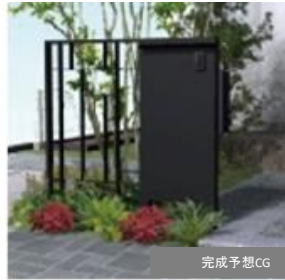
モンドリアン門柱