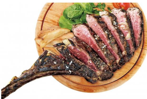
旨みの塊と言われる骨ごと熟成させることで、肉のポテンシャルを余すことなく引き出した熟成牛の最高峰『トマホークステーキ』

2017年3月30日(木)には、名古屋に初上陸となる注目の大型テーマパーク『LEGOLAND® Japan (レゴランドジャパン)』に隣接する商業施設『Maker's Pier (メイカーズ・ピア)』に、4月14日(金)には京都タワー内に新たに誕生する商業施設『京都タワーサンド (KYOTO TOWER SANDO)』に新店舗をオープンする。