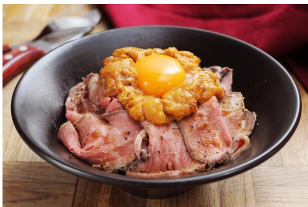
【うに×肉】とろける3つの食材が織りなすハーモニー『雲丹ローズトビーフ丼』