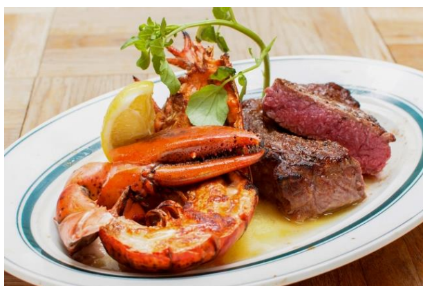
【肉×海鮮】の新提案『ロブスターグリル&ステーキ』