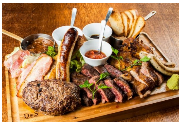
昨年の【Gotties BEEF 29 プレミアム・イベント】で話題沸騰となった肉盛り「NICK VILLAGE」