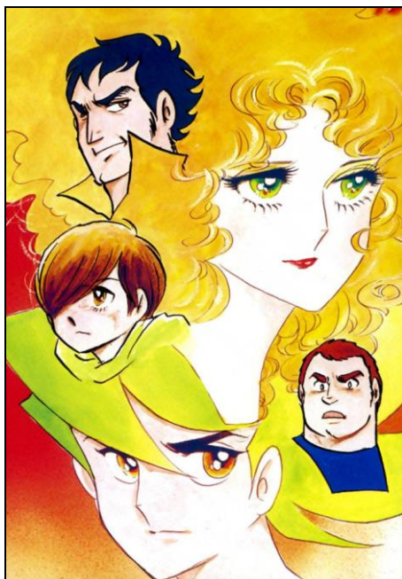
「作画グループ」時代「超人ロック(1)」巻頭収録のカラーイラスト (C)聖悠紀/SG 企画