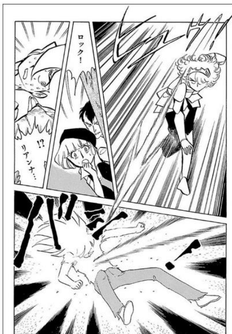
『超人ロック 完全版 (1) 炎の虎』 © 監修 少年画報社

「テレポート」とは、念力によって物理的な移動手段を使用せずに、自らの身体などを瞬間的に移動させることだ。「一瞬のうちに」という点に焦点を合わせた時は「瞬時移動」、「念力」に焦点を合わせた時は「観念移動」という意味になる。語源的には「テレ (tele)」=「遠い」に移動の距離感が込められている。超能力者はテレポートすると、その瞬間に姿を消している。通常空間から別次元に移動し、そこから出現地点までワープしているのだろうか。