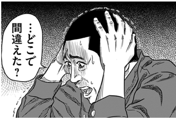
『報復刑』(トータス杉村) (C)トータス杉村/小学館

7月1日には「eBigComic4」で連載された「報復刑」0話から5話までをまとめた電子書籍版をeBookJapanにて先行販売し、「eBigComic4」の「ビッグな名作が生まれる現場!」にて前田が、この独特な物語が生まれた背景や著者トータス杉村の意外な一面などを語ったインタビューを公開いたします。