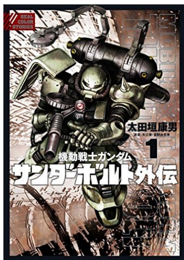
『機動戦士ガンダム サンダーボルト 外伝』 (太田垣康男 原案：矢立肇・富野由悠季) 全国書店にて発売中 880 円(税抜)

◆太田垣康男 初のオールカラーコミック『機動戦士ガンダム サンダーボルト 外伝』とは 『機動戦士ガンダム サンダーボルト 外伝』は、太田垣康男が「フィルムコミック」の発展形として、フィギュアアーティストとコラボし CG 技術を使って新しいかたちの漫画にすることができないか、という発想の原点でスタートいたしました。同作の本編である『機動戦士ガンダム サンダーボルト』がアニメ化され 25 日から全国 15 館でイベント上映されることもあって、ガンダムファンにとってはまさに雷電轟くようなイベント尽くしです。