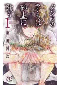
クジラの子らは 砂上に歌う 梅田阿比