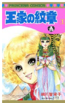
王家の紋章 細川智栄子 あんど芙〜みん