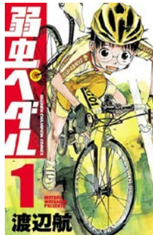
弱虫ペダル 渡辺航