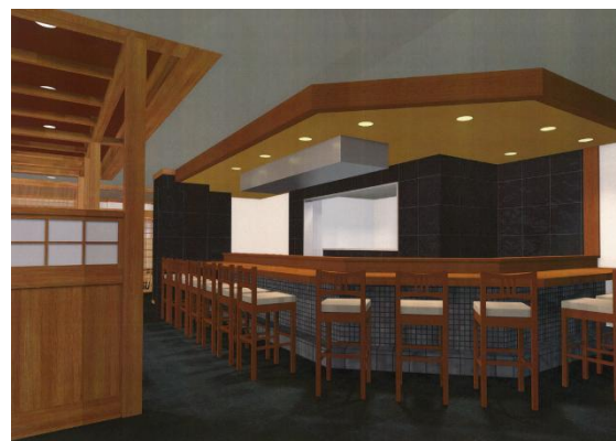
店内(客席数 101 席)