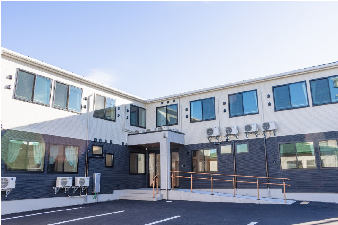
「ナーシングホーム悠ライフ津新町」外観

11月8日(金)、9日(土)に行われた新規開設「ナーシングホーム悠ライフ津新町」の内覧会の様子と施設の特徴についてお届けします。