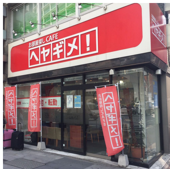
<ヘヤギメ！法人営業本部 東京駅前支店外観>