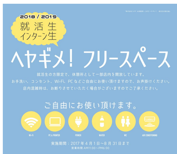
<ヘヤギメ! フリースペースポスター>

賃貸仲介店舗「お部屋探し CAFE ヘヤギメ!」を運営する株式会社 S-FIT(本社：港区六本木一丁目 6 泉ガーデンタワー 14 階 代表：紫原友規)は、4月1日(土)より、ヘヤギメ! 法人営業本部 東京駅前支店 の店内の一部スペースを、就職活動やインターン活動を頑張る学生に休憩スペースとして開放致します。