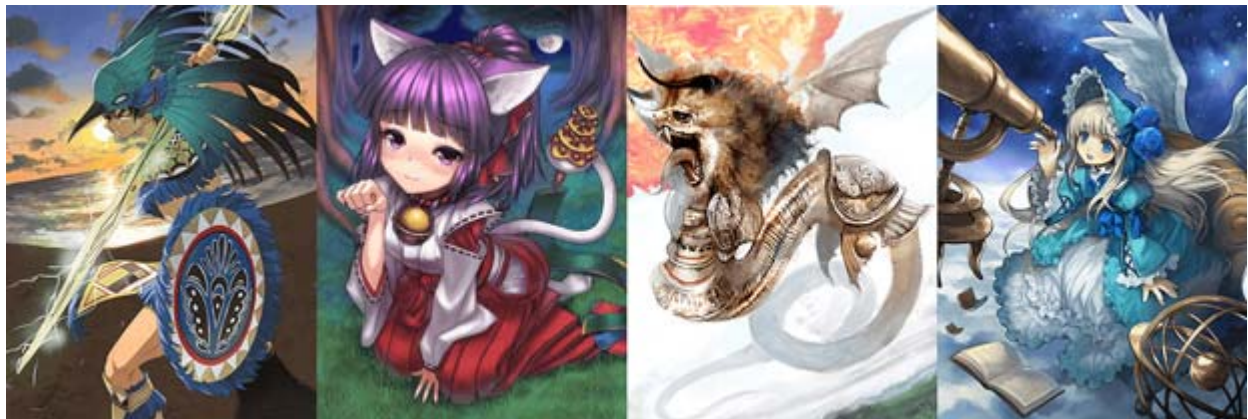
『蒼穹のスカイガレオン』エターナルカードパック第6弾「究理のマヤステカ」より