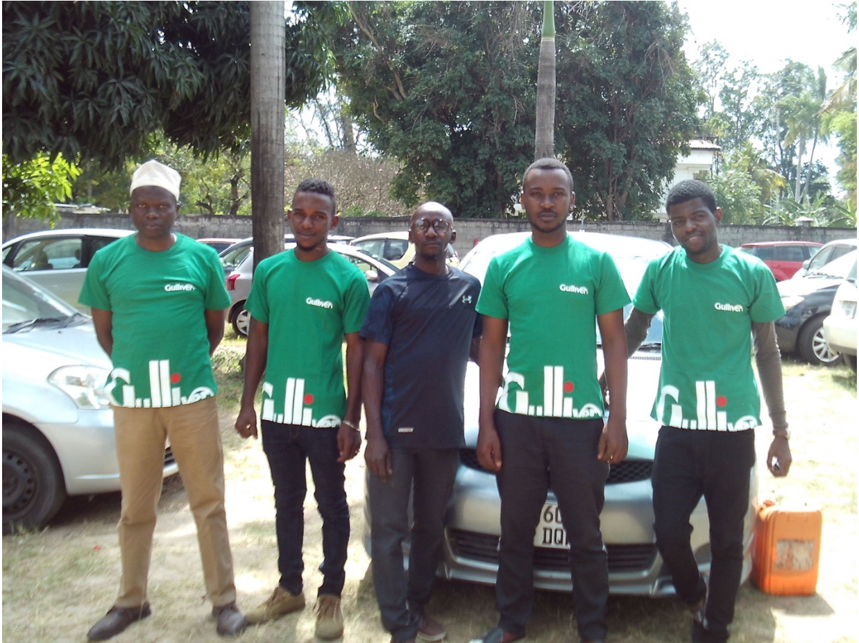
※本サービスを利用し、新たな生活を始めた現地のドライバーの様子