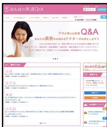
みんなの美活・トップページ

美容Q&Aサイト『みんなの美活』は、例えば【もうメイクで隠せない肌のくすみ】【「眠いの？」って聞かれる一重】【プルプルする下腹と二の腕】【治りにくく、何度も繰り返す大人ニキビ】など、女性なら誰もが悩んでいてもおかしくない様々な悩みや疑問を「質問」として投稿すると、それを解消・治療するためのアドバイスや方法を“美容医療のプロ”が「回答」する、という仕組みです。