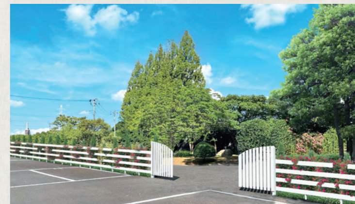
エントランスゲート